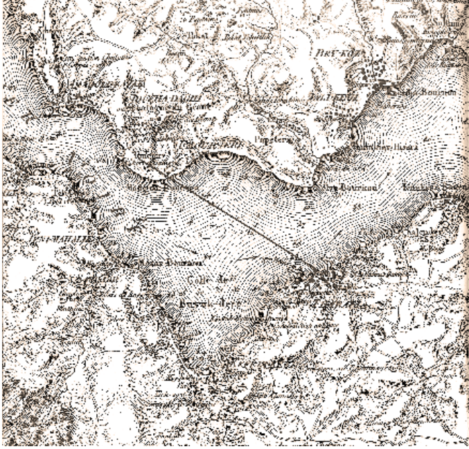
Eylül 'de Boğaziçi'ndeki olayların geçtiği Yenimahalle, Büyükdere, Tarabya gibi semtleri gösteren harita (Jean-Denis Barbié tarafından geliştirilmiş Kauffer Haritası, 1819).